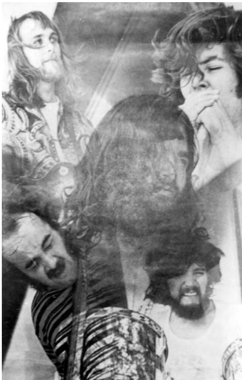
Le lineup « classique » de Canned Heat